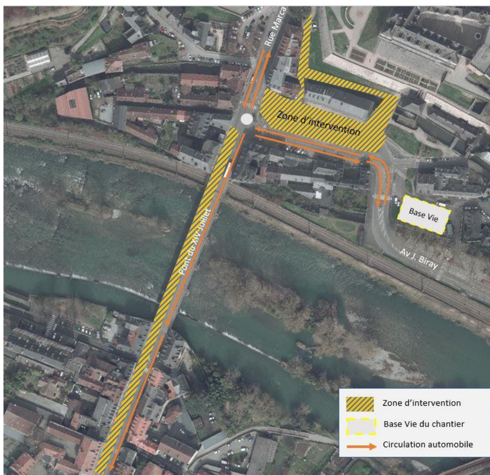
Zoom sur les zones travaux impactant les circulations du 16 janvier 2023 à fin mai 2023

Des itinéraires de déviation sont mis en place et communiqués par voie de presse et sur Pau.fr. Les circulations piétonnes et cycles seront quant à elles possibles grâce à des aménagements provisoires.