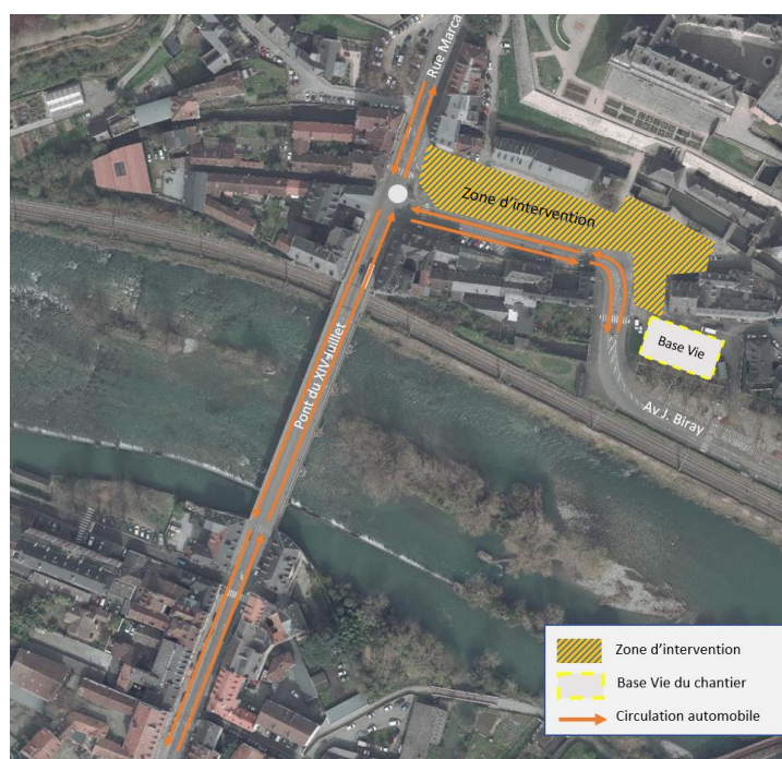
Zoom sur les zones travaux impactant la circulation du 25 novembre 2022 au 16 janvier 2023

Les aménagements n'étant pas définitifs, une vigilance reste de mise.